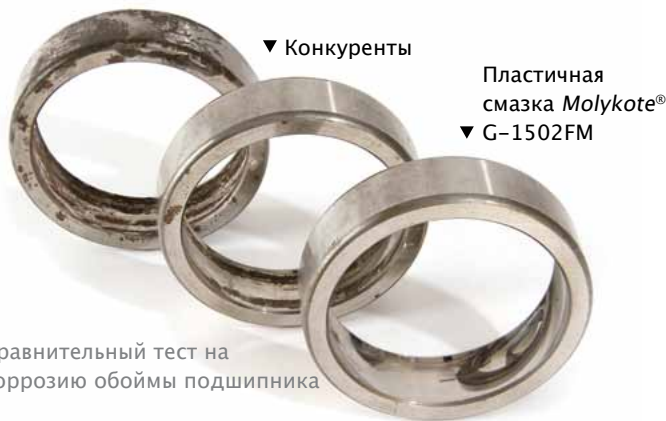
Сравнительный тест на коррозию обоймы подшипника